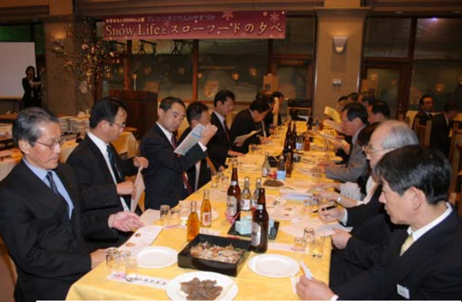
スローフードはキューピットバレイと地元グループの皆さんからご協力いただき、田舎の味をお楽しみいただきました