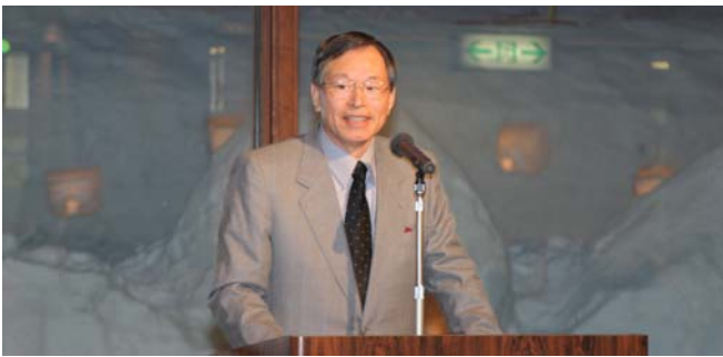
矢野学市議会議員様から雪のふるさと安塚のまちづくりについてご講演いただきました