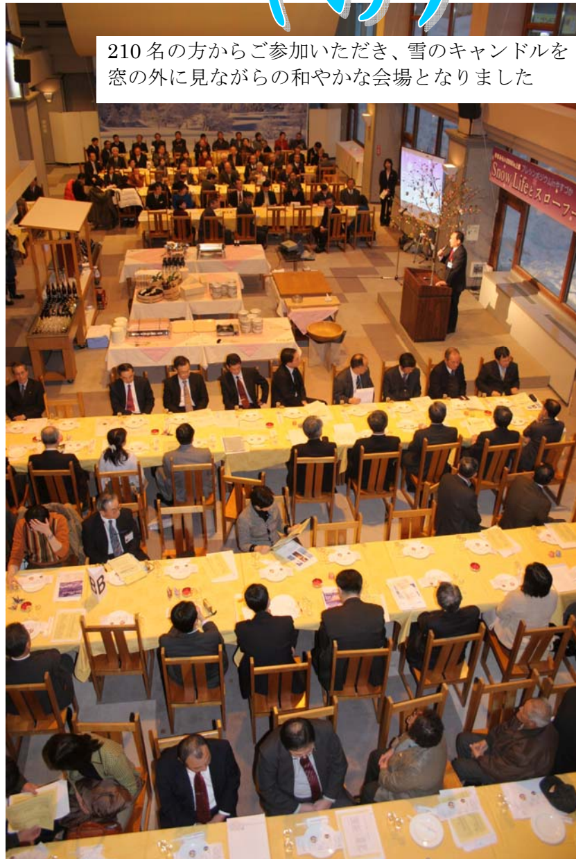
210名の方からご参加いただき、雪のキャンドルを窓の外に見ながらの和やかな会場となりました