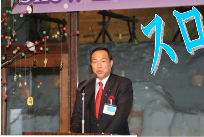
木浦上越市長様から開会のごあいさつをいただきました