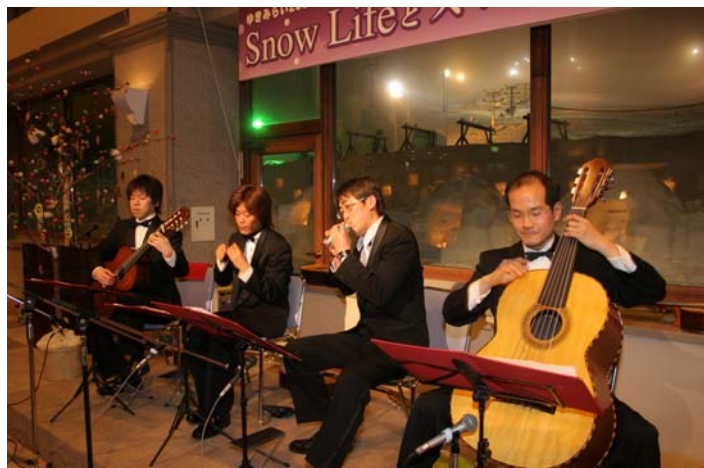
そば打ちの実演や上越市大島区の新堀芸術学院の皆さんの演奏、料理サービスと説明をしてくれた地元お母さん方によって会場は、かまくらの中のように、楽しく温かい雰囲気になりました