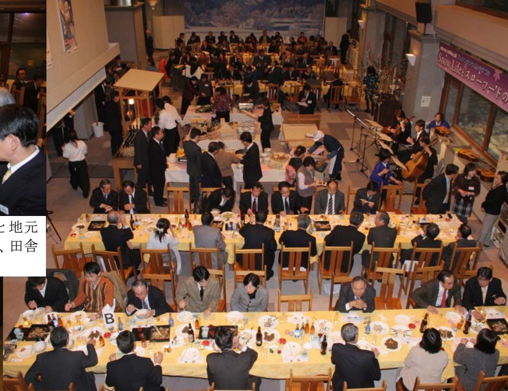
雪室で保存した雪中ワインや日本酒、安塚のどぶろく、そして新潟県内の銘酒も並び、田舎料理とともに味わっていただきました