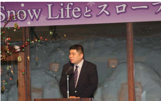
雪だるま財団伊藤が雪国の暮らしや雪エネルギーの紹介をしました