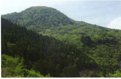
高丸山（たかまるやま）

千年の森広場には駐車場、トイレ、案内表示板を完備。中腹では、ブナの自然林が様々な命を豊かにはぐくんでいます。