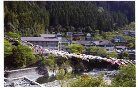
月ヶ谷温泉（つきがたにおんせん）

全長 87.7kmの日本一長い林道。シーズンにはオフロードのバイクや四輪駆動車に乗って多くのファンが訪れます。林道沿いに咲く仙太郎つじの見頃は、4月中旬～下旬頃。