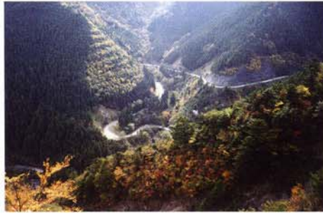
剣山スーパー林道（つるぎさん）

千年の森広場には駐車場、トイレ、案内表示板を完備。中腹では、ブナの自然林が様々な命を豊かにはぐくんでいます。