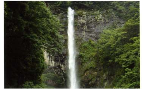
灌頂ヶ滝（かんじょうがだき）

清らかな溪流と、流れにそって広がる紅葉が有名ですが、春の新緑や溪流釣りなど、四季折々の楽しみ方ができます。