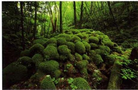
山犬嶽（やまいぬだけ）

弘法大師ゆかりの湯。春は 800 匹の鯉のぼりが空を泳ぐ「彩恋こい鯉まつり」、秋は上勝の自然体験ができるイベントが行われます。