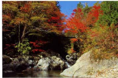
殿川内溪谷（ののかわうちけいこく）

原生林の登山道を行くと、広葉樹の森に巨石の風景が現れます。苔むした大地は夏でもひんやりとしています。